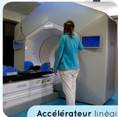
Accélérateur linéaire de particules HALCYON