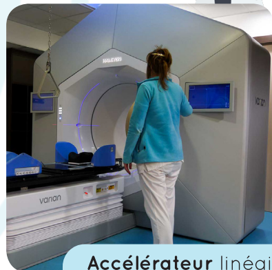
Accélérateur linéaire de particules HALCYON