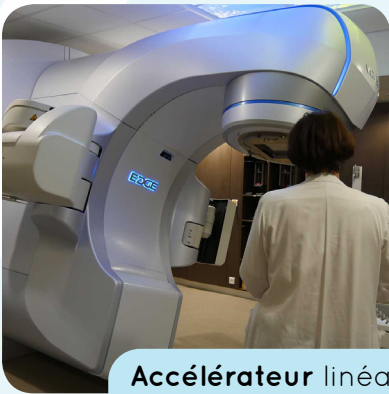
Accélérateur linéaire de particule EDGE