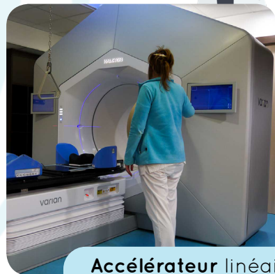
Accélérateur linéaire de particule HALCYON